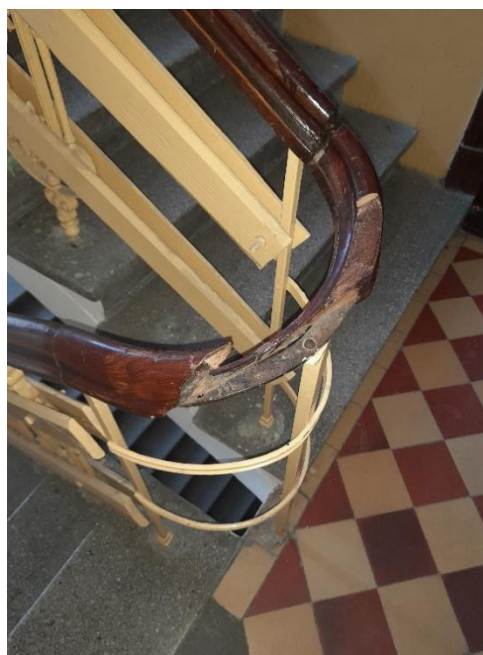
Drugie piętro – pozycja 2.3 w kosztorysie

Fragmety poręczy drewnianych, które są luźne należy poprawić i umocować na nowo.